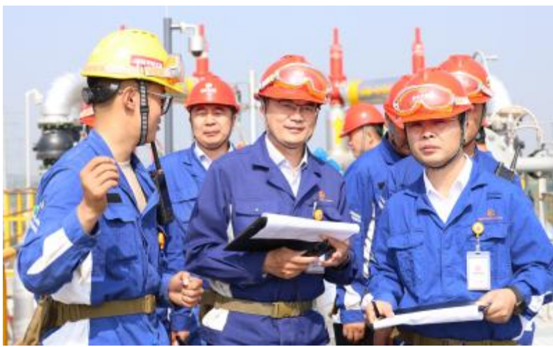
通威硅能源(内蒙古)开展现场JCC检查

这些高频次、多形式、内容丰富的安全活动,不仅精准覆盖冬夏极端时段、节假日等特殊管理节点,更推动安全管理从“被动要求”转向“全员自主自发动”:员工不再是活动的“旁观者”,而是“参与者”,“创造者”,让安全管理实现全时段、全岗位、全流程覆盖。一次次有温度、有深度的活动,将“安全第一”的理念融入日常、刻进心里,为企业安全文化筑牢了坚实根基。