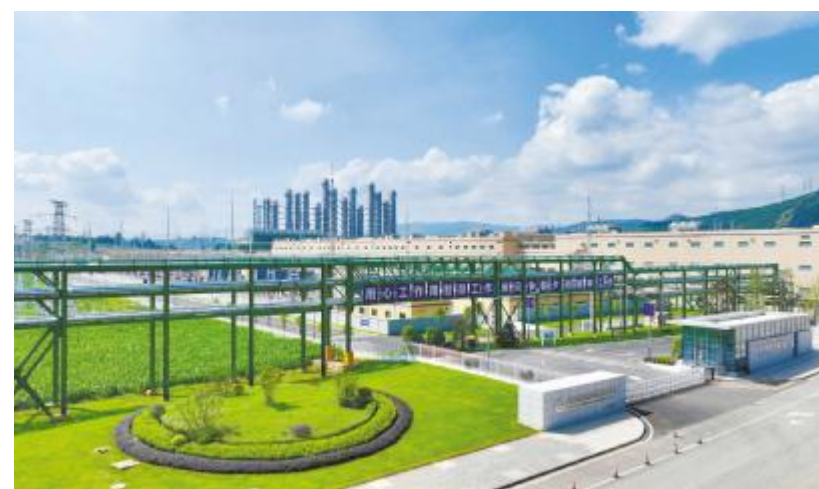
云南通威绿色厂区

云南通威将以此次入选国家级“绿色工厂”为新起点,持续深化绿色发展战略,严格落实国家级“绿色工厂”管理要求,动态跟踪优化生产环节,不断提升绿色制造水平。同时,公司将充分发挥标杆示范作用,总结推广绿色生产经验,带动产业链上下游协同绿色发展,助力区域经济高质量发展,为建设美丽中国、推动光伏行业绿色低碳转型贡献通威力量。