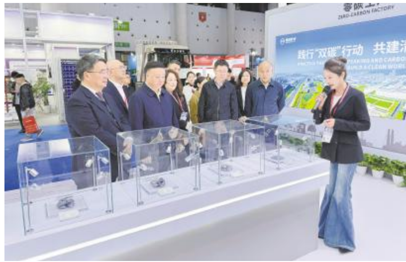
成都市副市长许兴国了解高纯晶硅

在新能源产业链上游,永祥股份始终坚持“绿色工厂生产绿色产品”的生产理念,不断创新,持续进步,自主研发的“永祥法”生产工艺,迭代应用至第八代,并储备至第九代,产品纯度达11个9(99.99999999%),全面满足