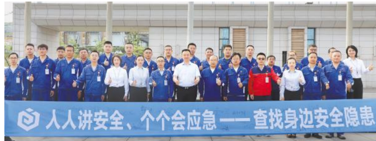
永祥光伏科技 & 永祥硅材料举行“安全生产月”启动仪式