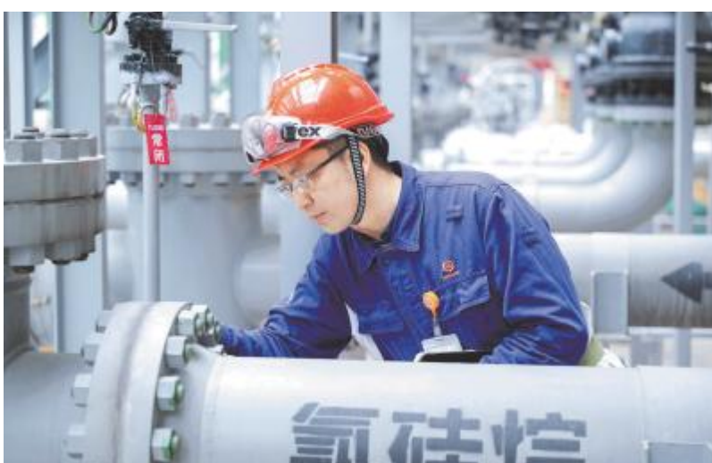
清单式标准化检修