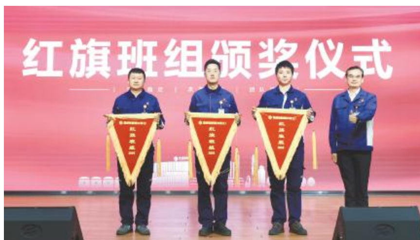
通威硅能源(内蒙古)第二十二期红旗班组颁奖仪式现场