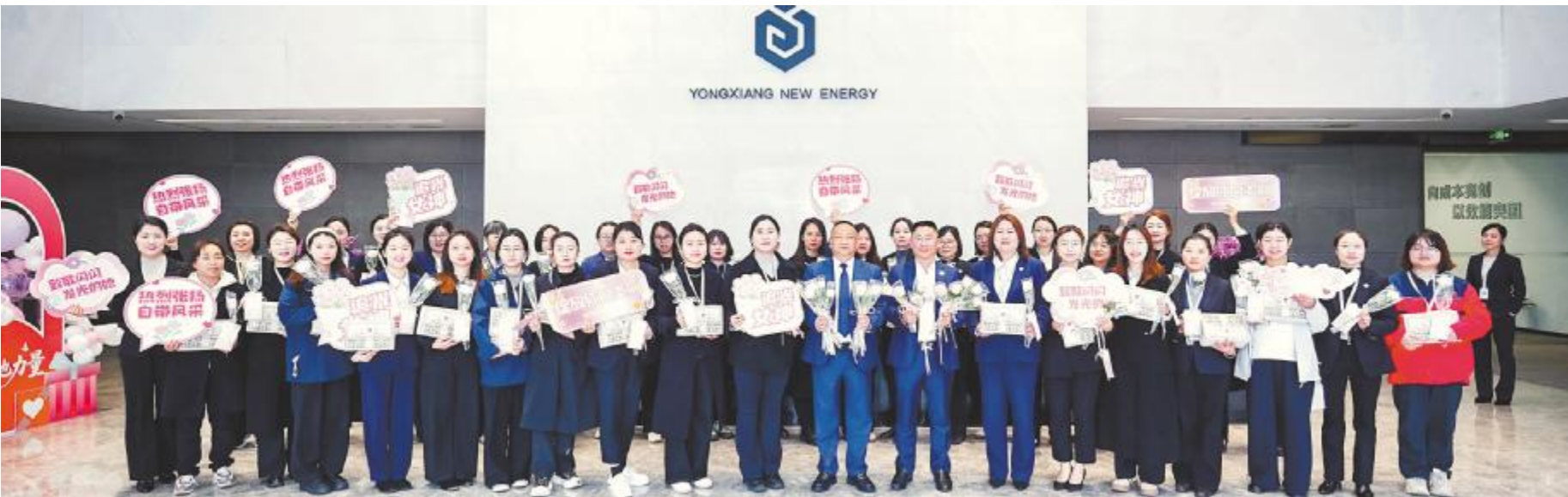
永祥股份成功开展“三八”国际妇女节主题活动

2026年,永祥股份将创新视为穿越行业周期、实现突破变革的核心动力,确立了“提质增效 突破极限”年度主题。全体干部员工进一步统一思想,凝聚合力,在提升工作质量与产品质量上狠下功夫、再练内功,持续寻求管理和技术双突破,全力以赴冲刺年度经营目标,谱写高质量发展新篇章。