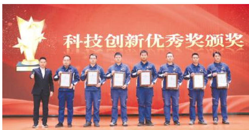
内蒙古通威开展2026年科技创新表彰大会