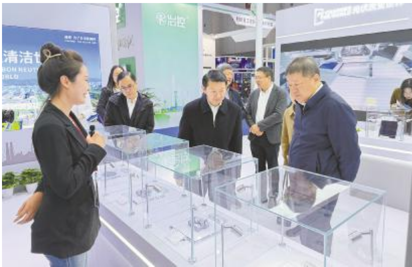
四川省经信厅党组书记、厅长翟刚莅临永祥股份展台

本届展会以“创链新工业,共碳新未来”为主题,围绕智能制造与绿色转型两大主线,全面赋能中西部制造业高质量发展,助力西部工业向高端化、智能化、绿色化升级。作为全球光伏产业垂直一体化领军企业,通威此次以“硅料-电池-组件”产业链布局构建起360°展陈空间。在核心展区,永祥股份工业硅粉、高纯晶硅