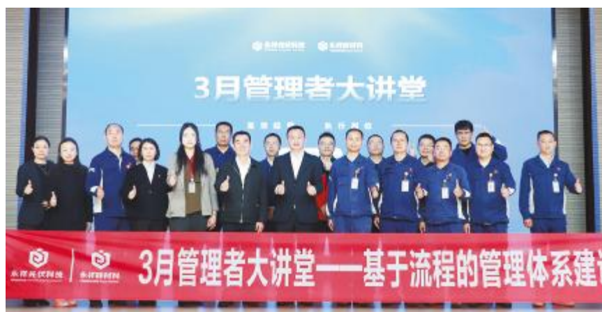
永祥光伏科技 & 永祥硅材料组织开展3月管理者大讲堂