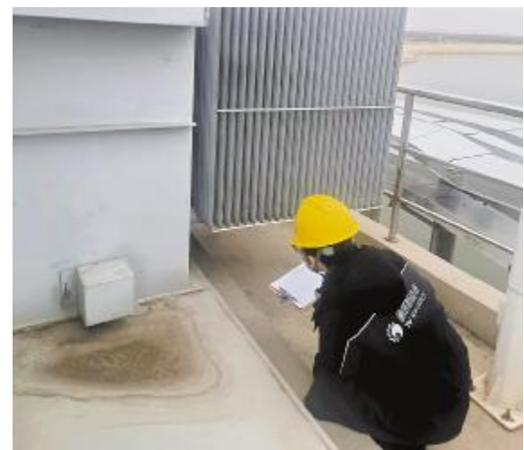
运维工作人员查看设备运行情况

透过窗户,高唐电站里那些光伏板静静立在水面上,像一队整装待发的骏马,等着明天的太阳,等着再一次扬鞭。