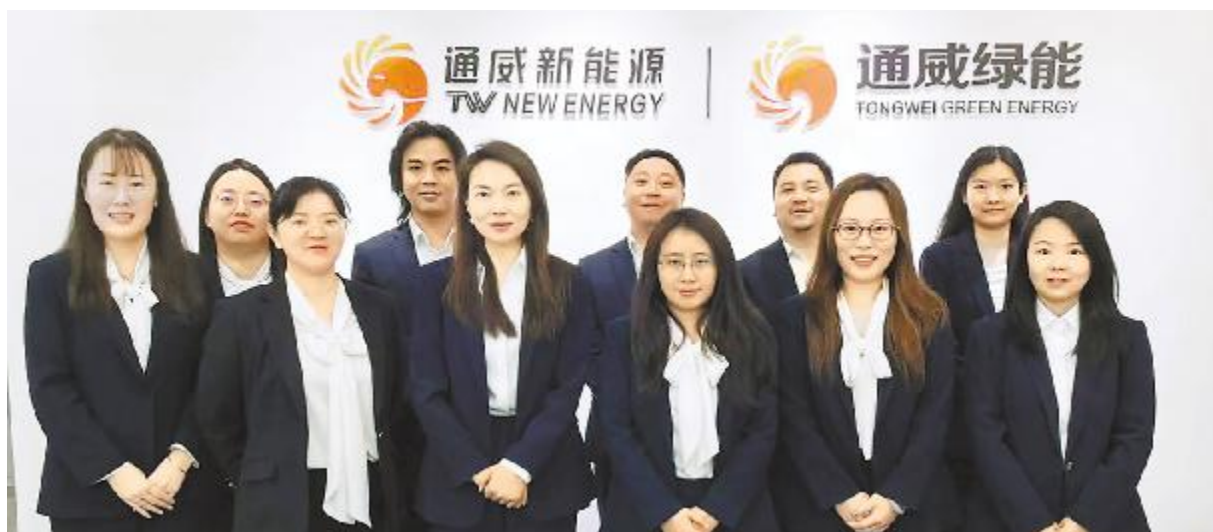
四川通威绿能电力有限公司

攻坚克难,青年团队在降本增效与绿电拓展中彰显青春力量。对标国网代购电价,骨干员工牵头攻坚,优化方案、细化管控,为通威太阳能基地累计降本 9728 万元;在此