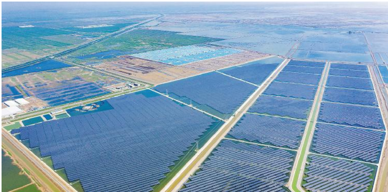
通威东营“渔光一体”生态园

今年,通威集团企业文化建设工作以“再练内功 策马扬鞭”为主题,将通威优秀文化与经营管理相结合,通过开展主题征文评选、演讲比赛等主线活动,持续推动高效经营,助力通威各项事业再上新台阶,实现长远发展目标。通威新能源积极响应集团企业文化建设工作要求,组织开展了“再练内功 策马扬鞭”主题征文活动,得到各业务公司、各部门的积极响应,踊跃投稿。本期,继续选登部分征文,以飨读者。