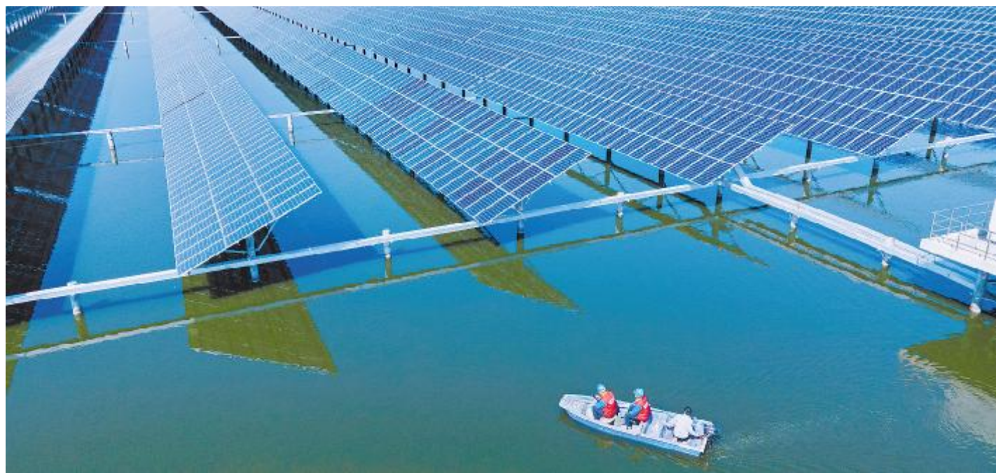
通威沾化“渔光一体”项目