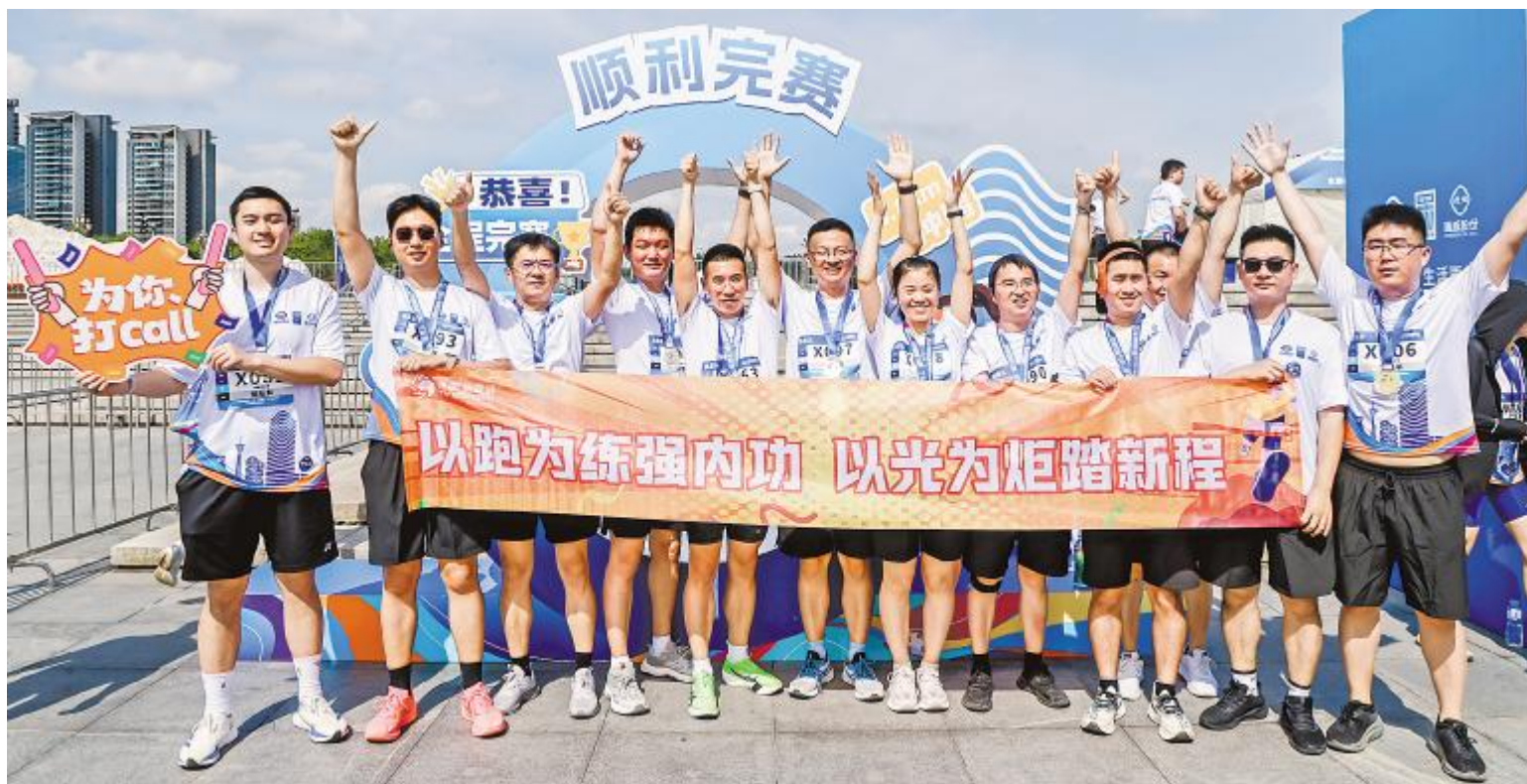
为拼搏点赞,为自己喝彩