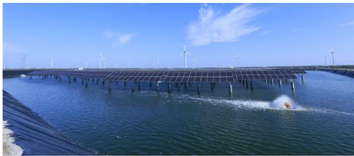
通威如东“渔光一体”基地