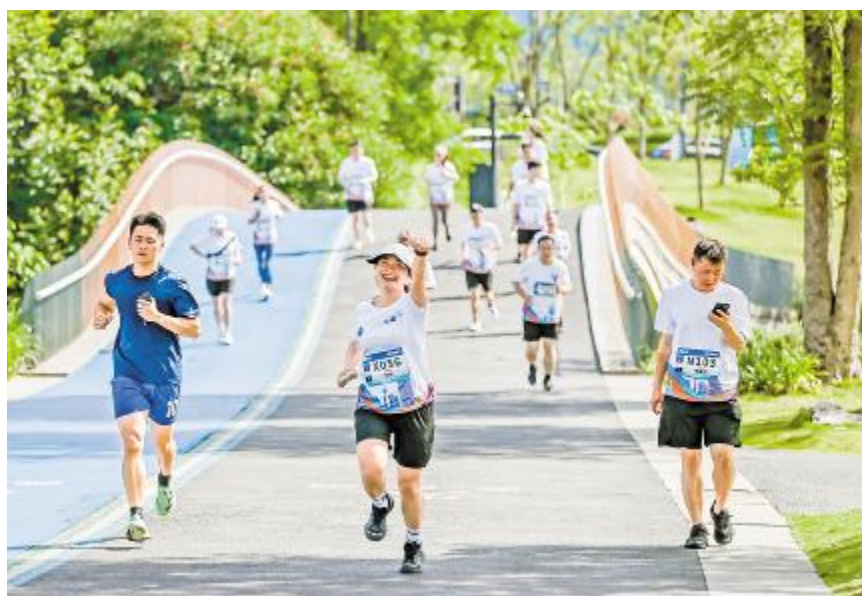
向着目标,一起奋进