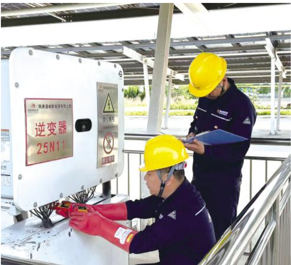
运维工作人员巡检光伏区

行业低谷是挑战,更是练好内功、蓄势待发的机遇;转型攻坚是压力,更是策马扬鞭、向新而行的契机。作为公司的职能保障部门,综合部将始终坚守价值初心,以精细化管理、专业化服务、人性化保障苦练内功,聚焦人才支撑、效能提升、合规运营、文化凝心四大核心,全方位赋能公司传统业务提质、新兴业务破局。