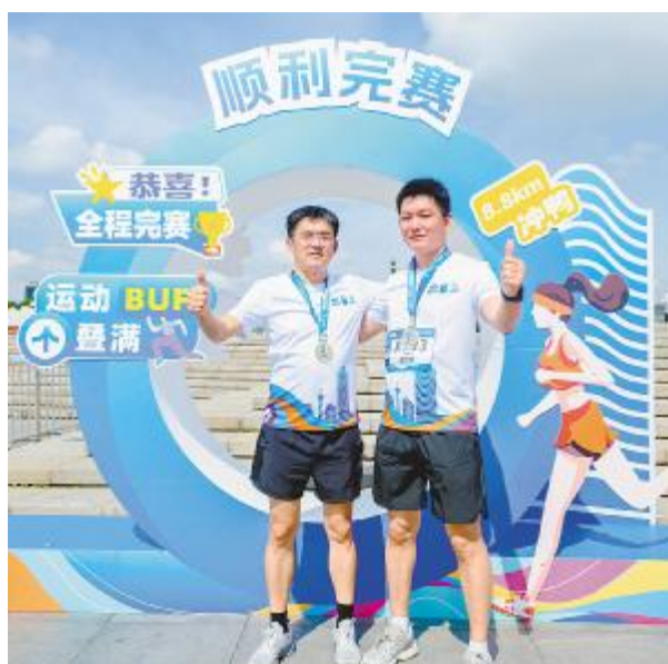
挑战极限,顺利完赛