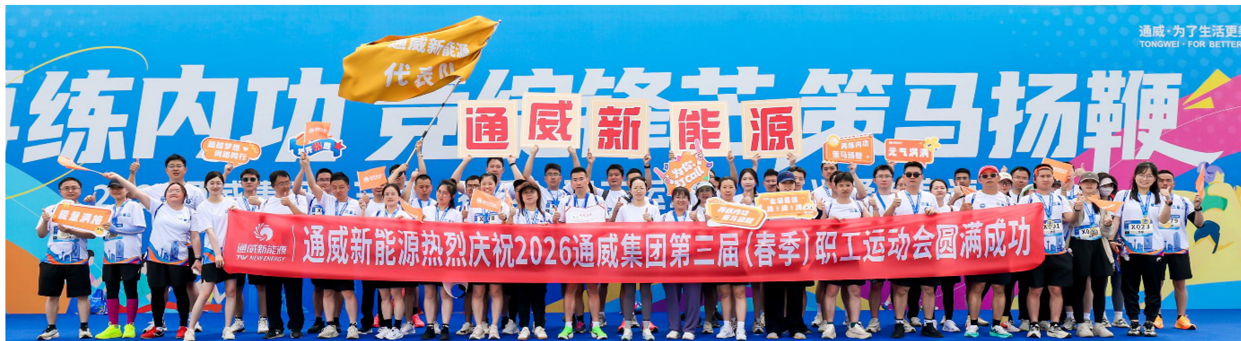
通威新能源代表队合影留念

4月29日,成都兴隆湖湿地公园化作一片活力的海洋。以“再练内功 竞绽锋芒 策马扬鞭”为主题的2026通威集团第三届(春季)职工运动会·环兴隆湖竞速跑在此火热举行。来自集团管理总部及相关多元板块、股份管理总部及通威新能源等各板块的8支代表队近700名员工齐聚湖畔,用奔跑点燃春日激情。