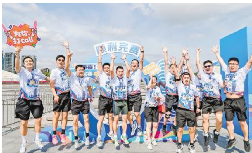
打卡留念,定格美好瞬间