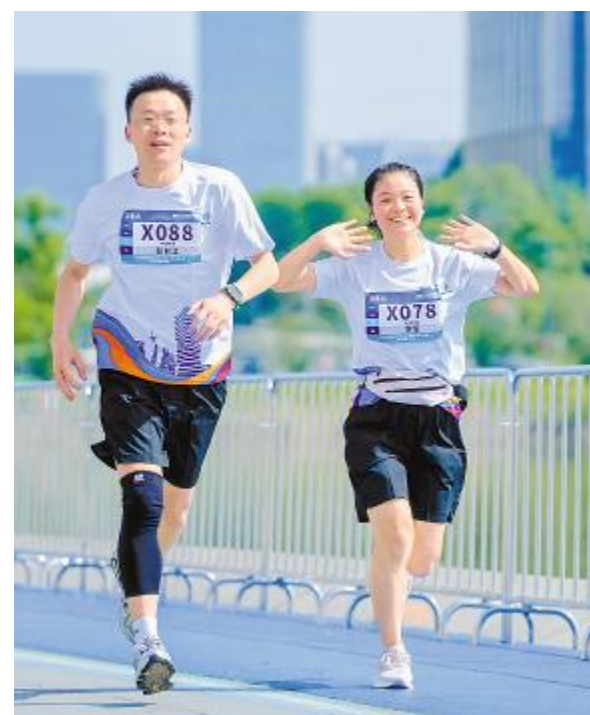
快乐奔跑,活力满满