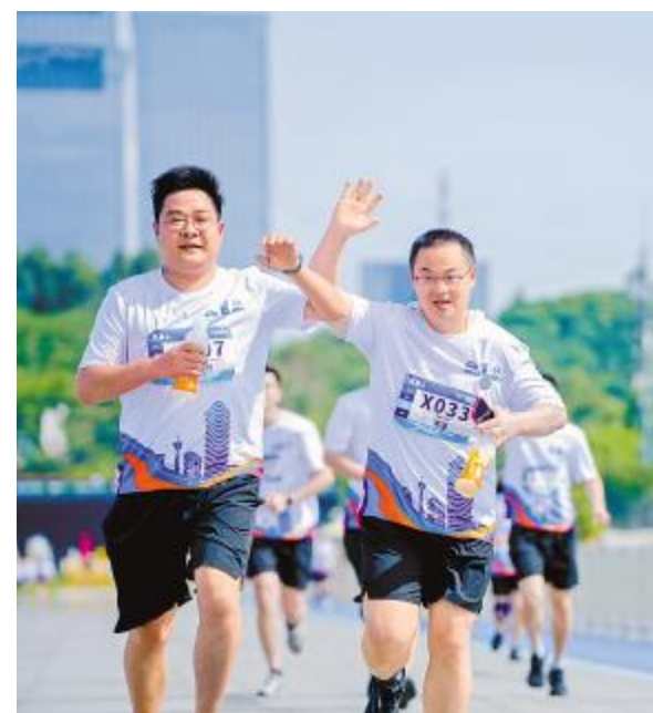
释放激情,展现风采